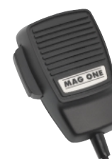
Mag One Mikrofon