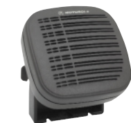
13W Externer Lautsprecher